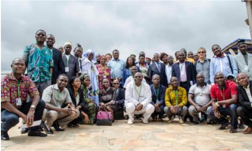
Photo de famille des participants au colloque venus de 7 pays de l'Afrique de l'Ouest et d'Europe